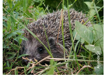
Igel - Tier des Jahres 2026.

Donnerstag, 28. Mai 2026, Pädagogische Hochschule Zürich, beim Hauptbahnhof Zürich, Lagerstrasse 2, Gebäude LAA, Raum LAA-J002b